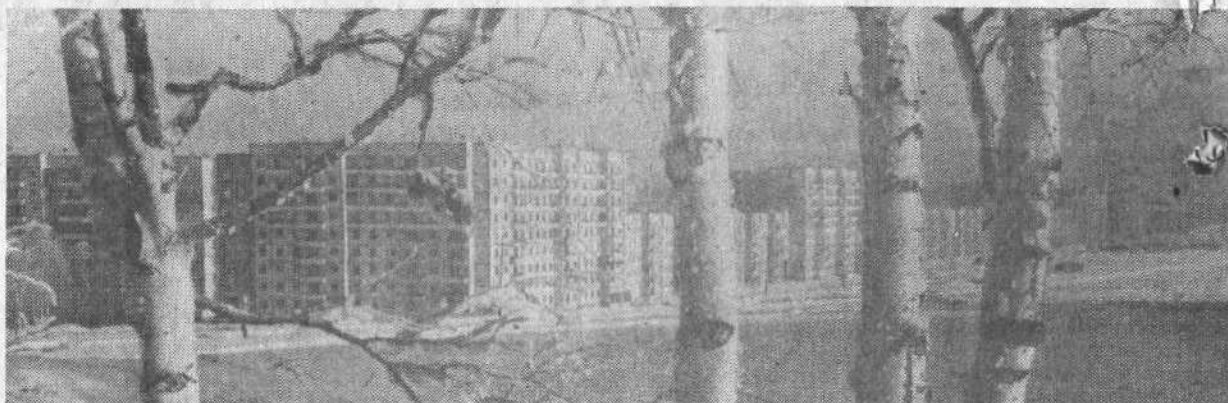
◆ Новостройки Тыргана. Их создают крепкие рабочие руки.