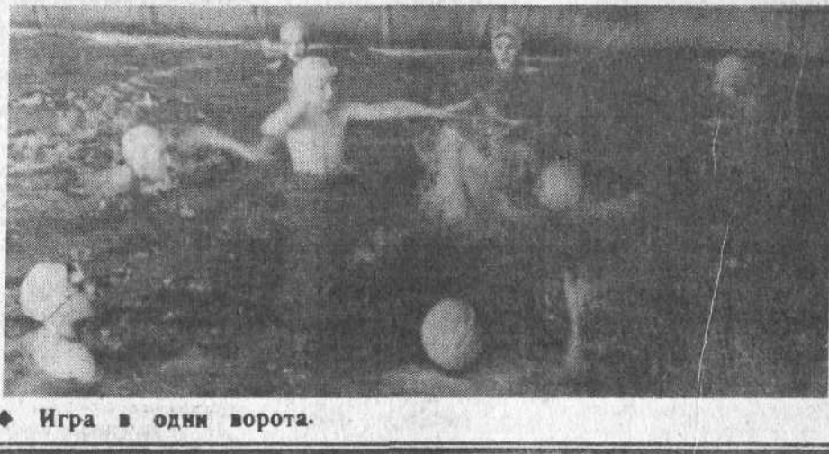
◆ Игра в одни ворота.