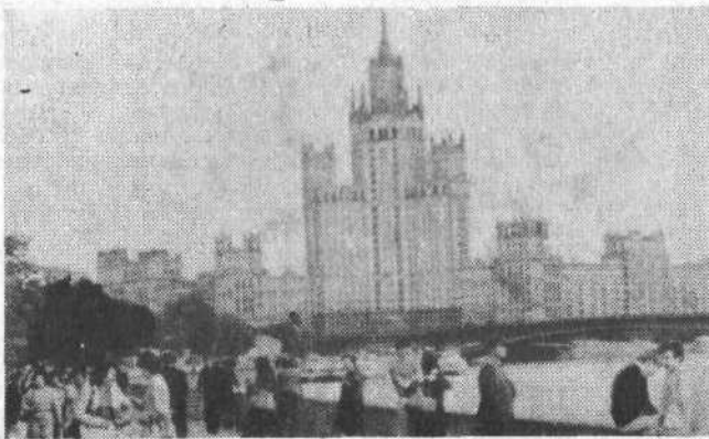
● МОСКВА. На Москворецкой набережной.