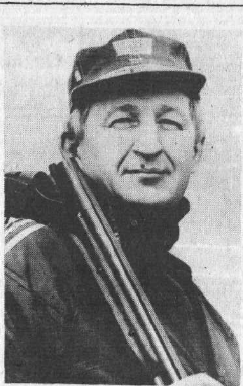
Фото и текст В. ЛЕЛЮХА.

5 ИЮНЯ — ВСЕМИРНЫЙ ДЕНЬ ОХРАНЫ ОКРУЖАЮЩЕЙ СРЕДЫ