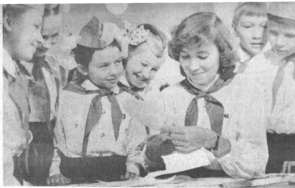
Пионеры школы № 72 вместе со старшей пионервожатой готовят сувениры на XII Всемирный фестиваль молодежи и студентов.

Л. ЮРЧЕНКО, председатель совета дружины школы № 62.