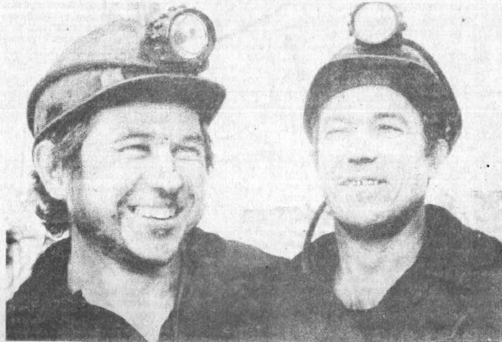
РАБОЧИЙ О СОРЕВНОВАНИИ

Шахты «ЦЕНТРАЛЬНАЯ», «НОГРАДСКАЯ», «ТЫРГАНСКАЯ», «КОКСОВАЯ», богатительные фабрики «КОКСОВАЯ», «ЗИМИНКА», разрез «ТАЛДИНСКИЙ-СЕВЕРНЫЙ», ЗАВОД РЕЗИНОВЫХ ИЗДЕЛИЙ, УМД и РГШО, КОМБИНАТ ХЛЕБОПРОДУКТОВ, КОНДИТЕРСКАЯ ФАБРИКА.