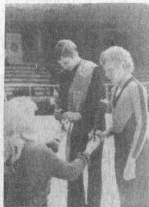
Итак, первая часть спартакиады завершилась. Проконсультирова-

Бороться до последнего — это девиз участников соревнований. Например, фигуристка из Горьков-