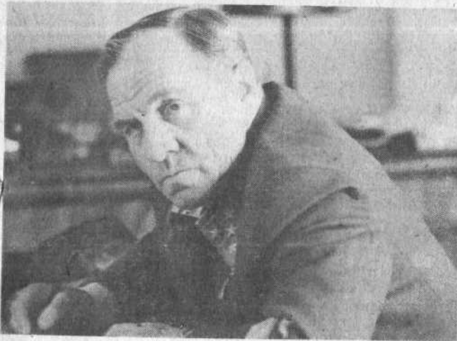
МОСКВА. На киностудии «Мосфильм» режиссер Юрий Озеров снимает новый фильм — кинооперу «Битва за Москву».

Оператор-востановщик новой картины И. Черных, художники - постановщики