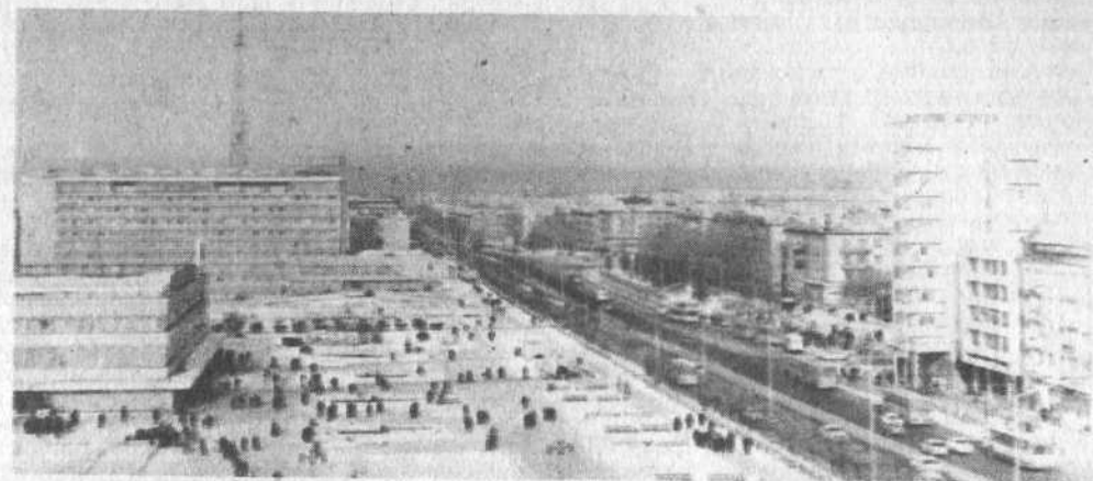
КАРАГАНДА. Здесь более 50 промышленных предприятий, которые ежегодно реализуют продукции почти

ждене социальные обязательства работников культуры на 1984 год. Р. АНДРЕЕВА, председатель горкома профсоюза работников культуры.