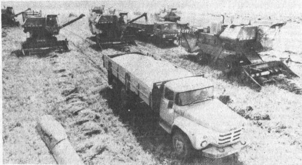
Липецкая область. Колхоз «Заветы Ильича» Липецкого РАПО выполнил годовой план продажи зерна государству.