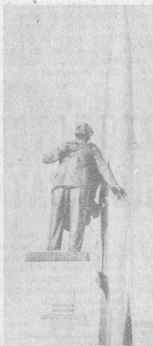
Великий русский ученый Константин Эдуардович Циолковский первым заложил основы ракетодинамики и космонавтики, определил пути их развития.