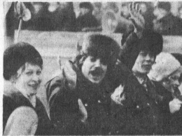
На снимках: праздничная демонстрация трудящихся города.

лостью. Специальными методами за отработку в третьем квартале отмечены коллективы Пронопьевского механизированного управления, стоматологической поликлиники № 1, РУККТС.