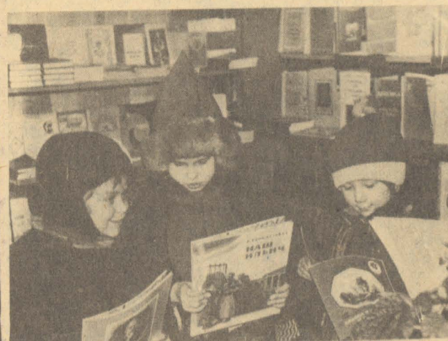
По традиции в дни весенних каникул у школьников идет Книжка неделя. Проклоповские девочки и мальчики тоже участвуют в этом литературном празднике. Он проходит в крупных книжных магазинах города. Созвал ребят на праздник и магазин № 72. Работники его сделали обзор книг о Владимире Ильиче Ленине, рассказали о произведении А. Гайдара «Поход».

Я постоянная зрительница смотра самодеятельности школ нашего города. И второй год мы присутствовали на выступлениях ребят школы № 68. Интересна и разнообразна программа. Грамотно, высококачественно работают здесь. Удивил и порадовал мексиканский танец, ко-