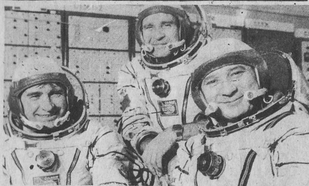
На снимке: экипаж космического корабля «Союз Т-3» (справа налево) командир корабля Л. Д. Кизим, бортинженер О. Г. Макаров и инженер-исследователь Г. М. Стрекалов.