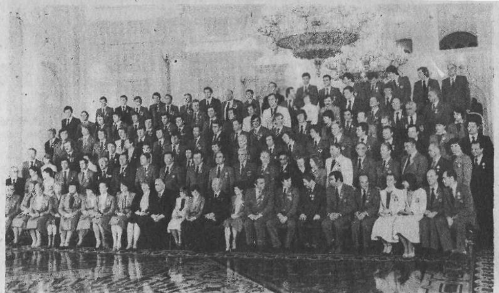
В Кремле большой группе спортсменов, тренеров, работников физи-

Вообще в Центральном районе только Ясная Поляна в этом году плохо подготовилась к спортивной зиме: там нет ни ол-