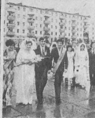
«День советской семьи» — вот уже шестой год проводится этот праздник в городе Кропоткин Краснодарского края.

По центральной улице прошли известные в городе трудовые династии, во Дворце культуры железнодорожников) состоялось их чествование. На нарядно украшенных площадях и улицах состоялись массовые гуляния, спортивные состязания под девизом «Папа, мама и я — спортивная семья».