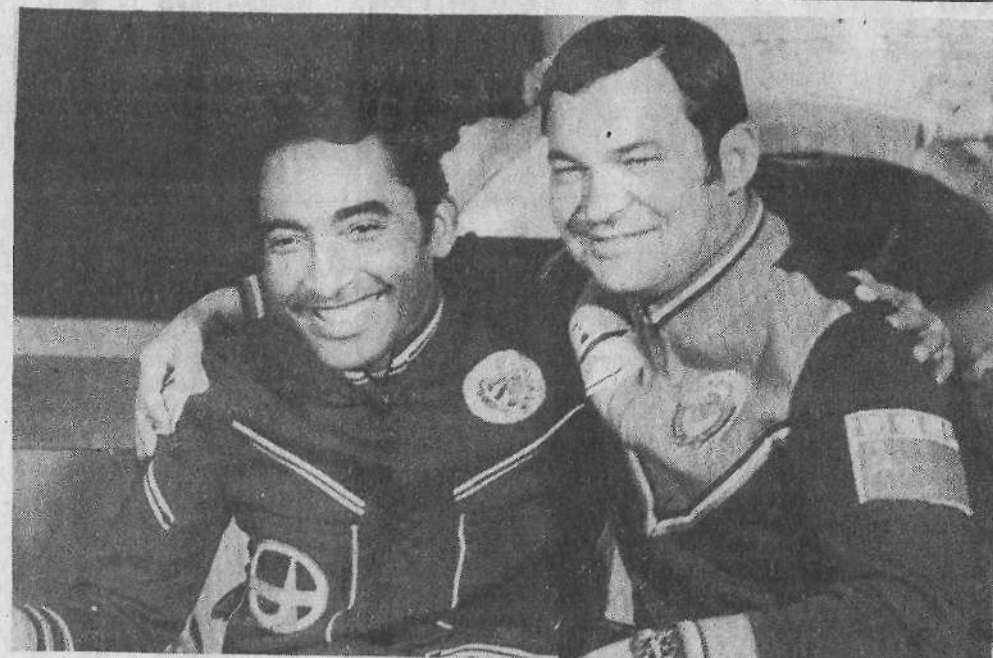
Международный экипаж космического корабля «Союз-38»: командир экипажа, летчик-космонавт СССР, Герой Советского Союза, полковник

Юрий Викторович Романенко (справа) и космонавт-исследователь, гражданин Республики Куба, подполковник Арнал'до Тамайо Мендес во время предполетных занятий в Центре подготовки космонавтов имени Ю. А. Гагарина.