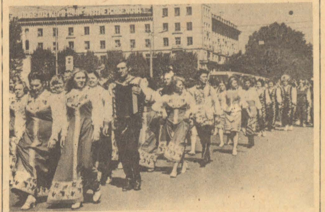
На снимках: парад участников художественной самодеятельности; поет сводный хор.

Инструменталисты, вокалисты, танцоры в который раз порадовали слушателей своим мастерством.