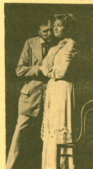
На снимках: сцена из спектакля «Иванов». Иванов — народный артист СССР И. Смоктуновский, Саша — Е. Кондратова; здание театра.

Главными творческими задачами театра сегодня являются утверждение социалистической действительности, новых нравственных ценностей, раскрытие духовной красоты советского человека. Интересен и многообразен его репертуар. С огромным успехом проходили гастроли театра в Америке, Англии, Греции, Австрии, Японии, Венгрии, Болгарии и многих других странах.