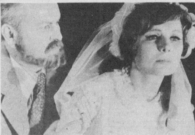
На снимках: сцены из спектакля.

Драматический театр имени Ленинского комсомола представил на суд прокопьевских зрителей новый спектакль «Здесь наш дом» по пьесе Е. Чебалина «Добежать, отдышаться...». Премьера спектакля, посвященного юбилею Родины, состоялась в канун празднования 60-летия Октября. Это обязывало отнестись к новой работе, как к программной, требовало максимальной мобилизации всех творческих сил коллектива театра.