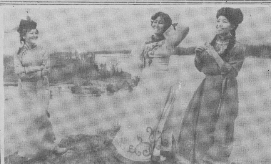
Тувинская автономная Советская Социалистическая Республика. Далеко за пределами республики известно искусство ансамбля песни и пляски «Саяны» Тувинской государственной филармонии. Он выступал во многих городах страны.

лы контрреволюции предпринимали отчаянные попытки оторвать республики от новой России, чтобы затем покончить в них с Советской властью и восстановить старые порядки. Становилось все более очевидным, что нанести поражение врагу можно только во главе с русским народом,