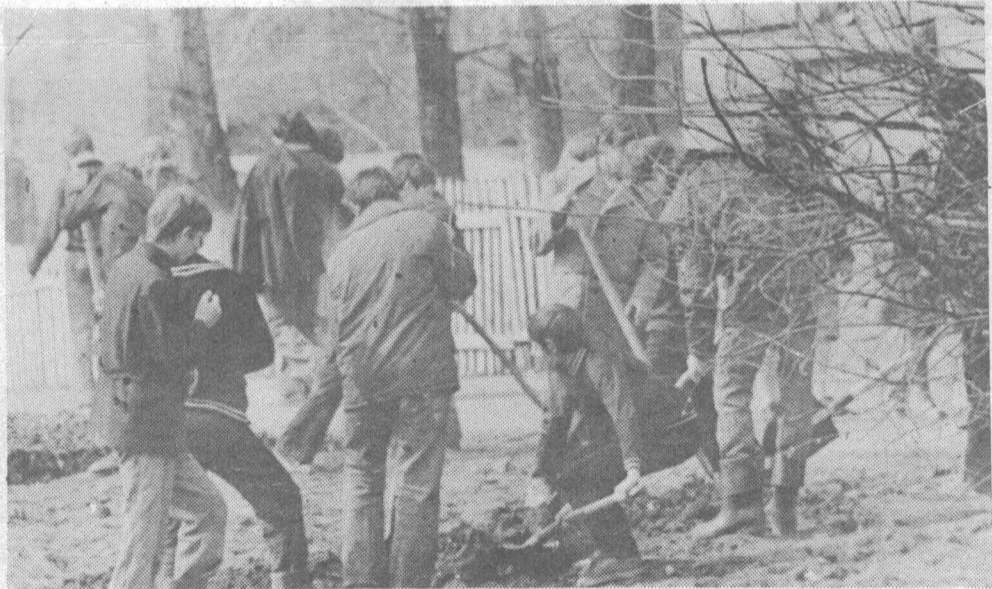
Учащиеся школы № 48 на благоустройстве своей территории.