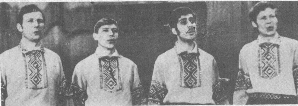
ГОРОДСКОЙ СМОТР ХУДОЖЕСТВЕННОЙ САМОДЕЯТЕЛЬНОСТИ

И с самого первого аккорда песня завладела залом. Она зазвучала широко и сильно, и с каждой музыкальной фразой все нарастала ее мощь... Замечательно можно сказать, профессионально. Зрители восторженно аплодируют. После выступления «ар-