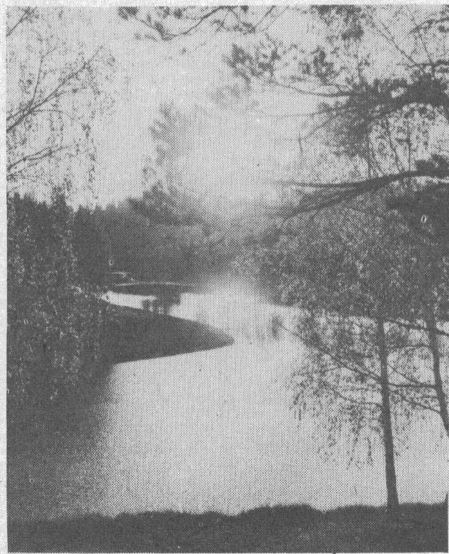
● Весенний пейзаж.