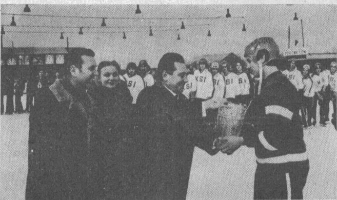
На снимках: команда-победительница; хоккеисты у памятника советским воинам; момент игры; вручение кубка победителям.