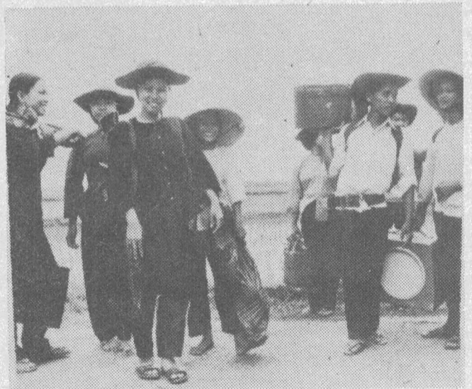
● Народная власть Южного Вьетнама проявляет большую заботу о тружениках сельского хозяйства. В городах созданы специальные бригады из молодежи и студентов, которые выезжают с концертами в сельскохозяйственные районы страны.

Северный Вьетнам, который в этот переходный период на пути к социализму идет впереди Южного Вьетнама, будет оказывать всемерную помощь югу. Как заявил глава делегации Северного Вьетнама на конференции, член Политбюро ЦК ПТВ,