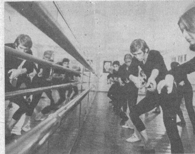
На снимке: идут классные занятия в самодеятельной студии пантомимы, созданной при Дворце культуры железнодорожников Челябинска.