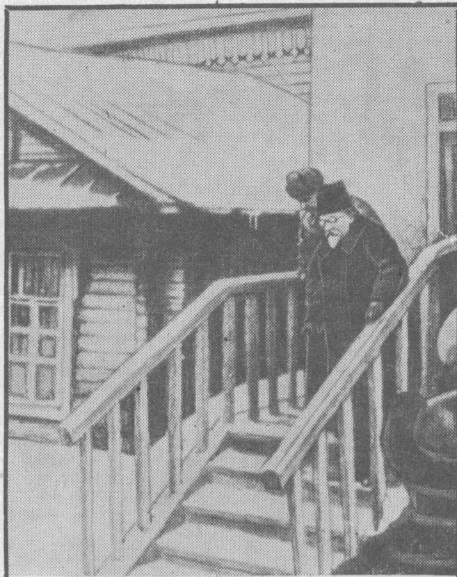
СЕГОДНЯ ИСПОЛНЯЕТСЯ 100 ЛЕТ СО ДНЯ РОЖДЕНИЯ М. И. КАЛИНИНА

Передовые представители шахты в своем обращении к товарищам, прозвучавшем перед ноябрьскими праздниками этого года, напомнили об одном из напутствий Калинина: «Поменьше «ура», побольше «угля». Они призвали горняков стать с 10 ноября на вахту в честь