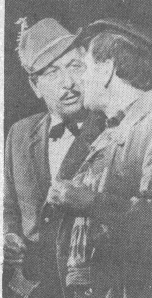
На снимках: сцены из спектаклей «Свадьба в Малиновке» и «Вторая свадьба».