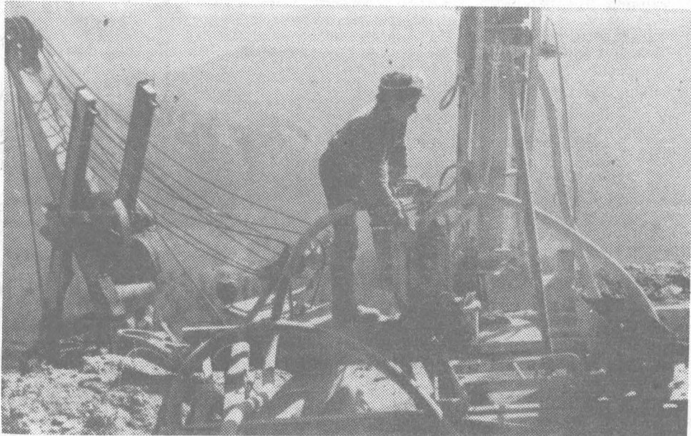
На снимке: буровые работы в карьере близ поселка Означенное, где обнаружены крупные запасы мрамора.

Завод по обработке саянского мрамора будет поставлять ежегодно 300 тысяч квадратных метров облицовочных плит.