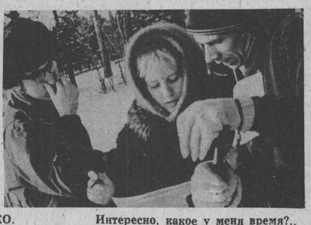
Интересно, какое у меня время?..

Около ста молодых рабочих, инженеров цехов, отделов завода «Электромашина» участвовали в лыжных эстафетах. Трассы их были проложены в живописном Зенковском бору. В упорной спортивной борьбе победу одержал мужской квартет цеха № 11 и женский из заводского научно-исследовательского института. В общекомандном зачете первенствовал коллектив физкультуры цеха № 11. 2 февраля — второй этап лыжных соревнований — индивидуальные гонки.