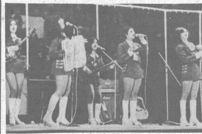
Редактор Ю. С. ТОТЫШ.