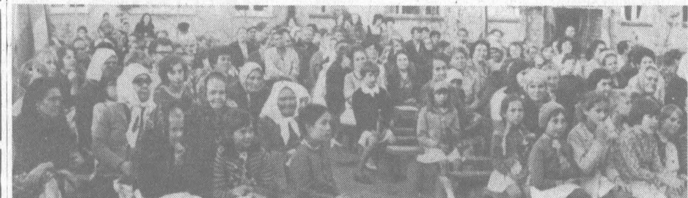
Праздник для всех.

Вот они, лучшие люди, все вместе, на сцене. Для них участники художественной самодеятельности исполняют любимые песни. Им вручают памятные сувениры и цветы. И слова приветствия героям торжества, всем, кто работает на заводе и живет на этой улице, произносит председа-