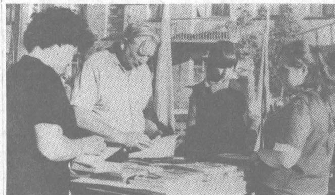
Здесь можно купить интересную книгу.

Красочно украшена агитплощадка: яркие флажки, цветные шары, флаги. Стенды с портретами передовиков производства, рассказывающие о планах реконструкции завода, благоустройства 13-го квартала. Здесь же открыли торговые ряды магазины «Спутник», «Уют», столовая № 7 и книжный магазин. Работники службы быта дали