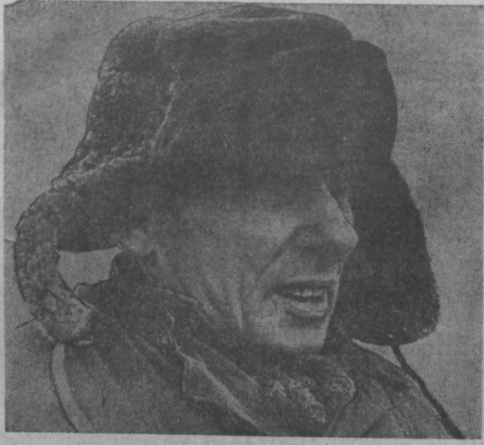
ВЕСТИ С ПУСКОВЫХ ОБЪЕКТОВ