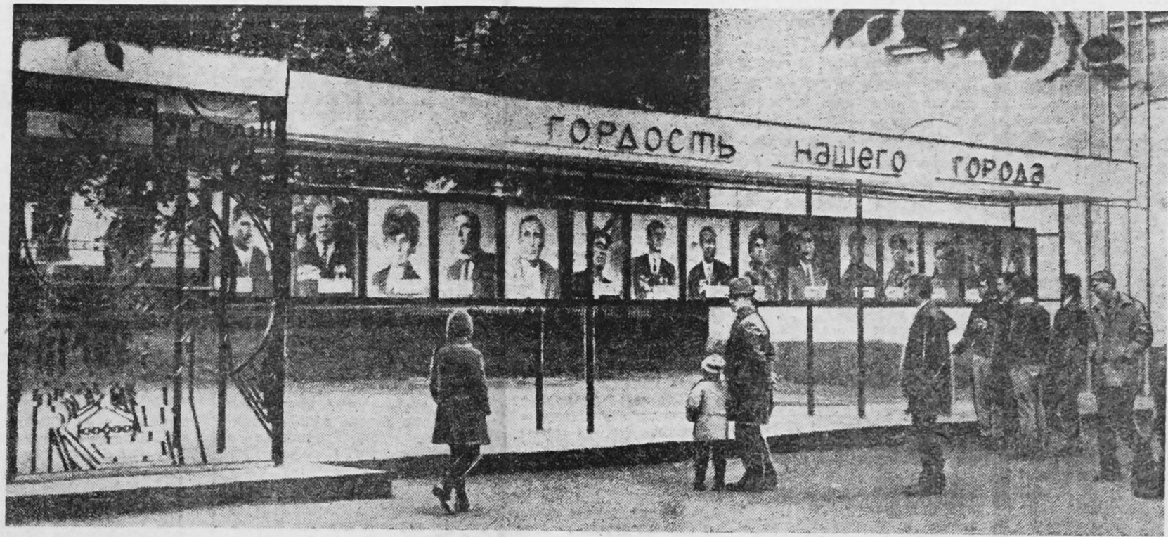
«Гордость нашего города» — так называется портретная галерея передовых шахт, заводов, строек, которая находится на проспекте шахтеров. Недавно галерея обновилась. В ней портреты 15 трудящихся, отличившихся в социалистическом соревновании по достойной встрече 50-летия образования СССР.