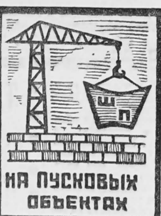
НА ПУСКОВЫХ ОБЪЕКТАХ

много. Но и это была бы не беда, если бы нас снабжали всем необходимым. Во-вторых, с нас требуют работать в две смены, а мы полностью не загружены даже в одну. То на стройке нет битума, то арматуры, а последние три дня вторая смена не работает потому, что не могут найти машину, чтобы привезти арматуру.