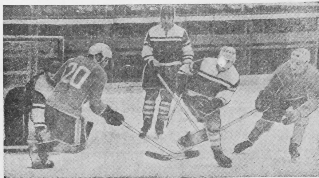
г. Усть-Каменогорск.

Сегодня на стадионе «Шахтер» — большой футбол. Соперники нашей команды — динамовцы Барнаула. Команда интересна тем, что в ее составе много игроков, которые прошли многие члены клуба «Динамо». Несмотря на то, что барнаульцы не занимают высокие места в турнирной таблице, их игра оставляет приятное впечатление.