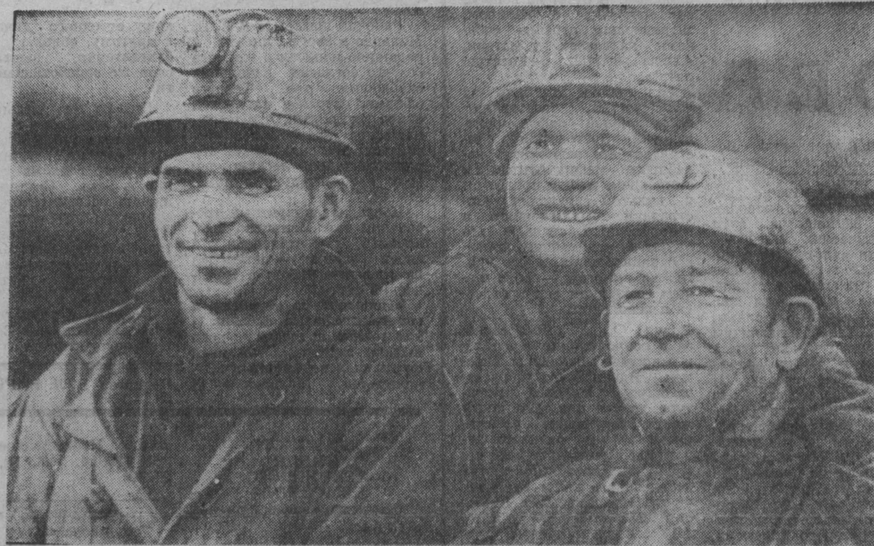
ВЧЕРА КОЛЛЕКТИВ ПОДГОТОВИТЕЛЬНОГО УЧАСТКА № 24 ШАХТЫ «КОСОВАЯ» ДОВЕЛ СВЕРХПЛАНОВУЮ ПРОХОДКУ С НАЧАЛА НОЯБРЯ ДО 18 МЕТРОВ. УСПЕШНО ВСТРЕЧЕН ЭТИМ КОЛЛЕКТИВОМ И ОКТЯБРЬСКИЙ ПРАЗДНИК — НА 87 МЕТРОВ ПЕРЕКРЫТО ЗАДАНИЕ ПРОШЛОГО МЕСЯЦА.

Материалы «круглого стола» подготовила В. ЕРОФЕНКО.