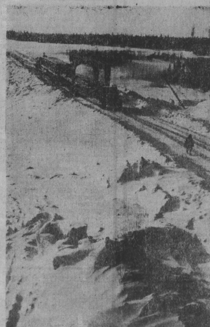
НА СНИМКЕ: таешная трасса. Идет укладка рельсов.

За неполных полтора месяца жизни в Костино В. И. Ленин написал более 130 документов по вопросам партийного, государственного, хозяйственного строительства, внешней политики республик Советов. (ТАСС).