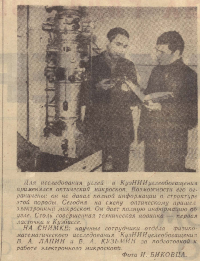
Для исследования улей в КузНИИ углеобогатения применялся оптический микроскоп. Возможности его по сравнению с обычной информацией о структуре этой породы...

Все это только небольшая часть того, что пришлось сделать за последние годы. А многочисленная шахтная автоматика, выпускаемая заводом, давно уже надежно служит нашим и зарубежным шахтерам.