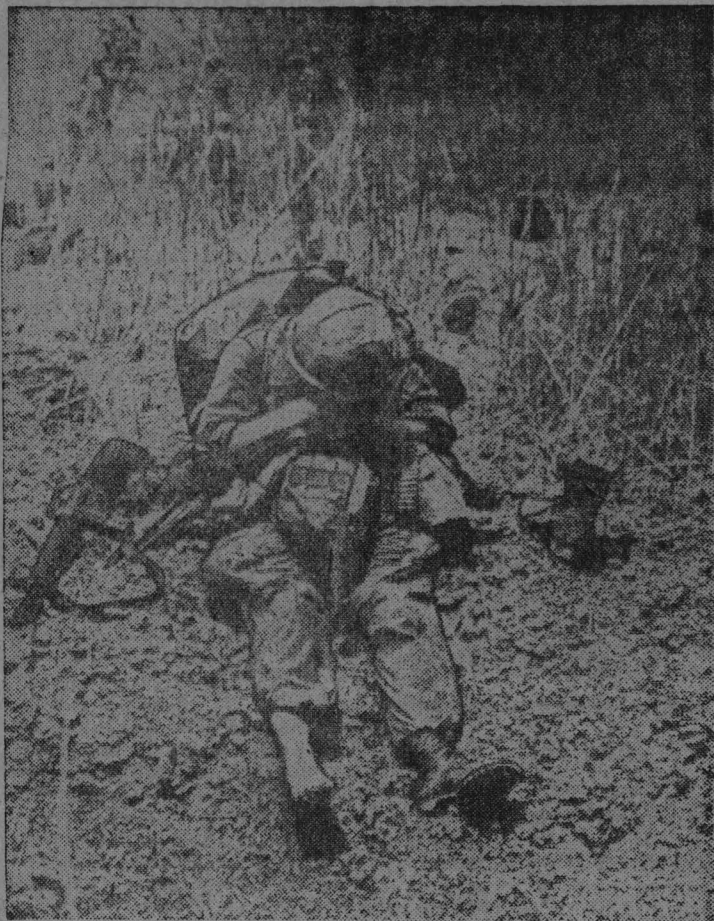
«Почему?» Вьетнам, апрель 1968 год. Этот снимок экспонируется на международной выставке «Уорлд Пресс-фото, 68-69» в Гааге.