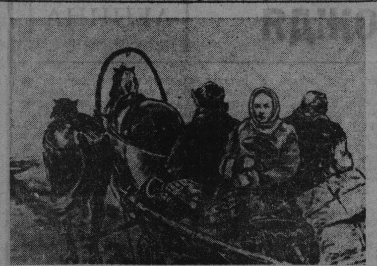
Н. К. КРУПСКАЯ на пути в Шушенское — 7 мая 1898 года.