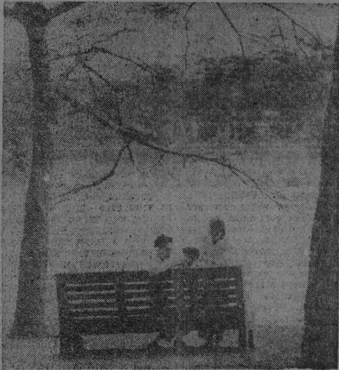
ДРВ. На берегу озера Возвращенного меча в Ханое в выходной день.