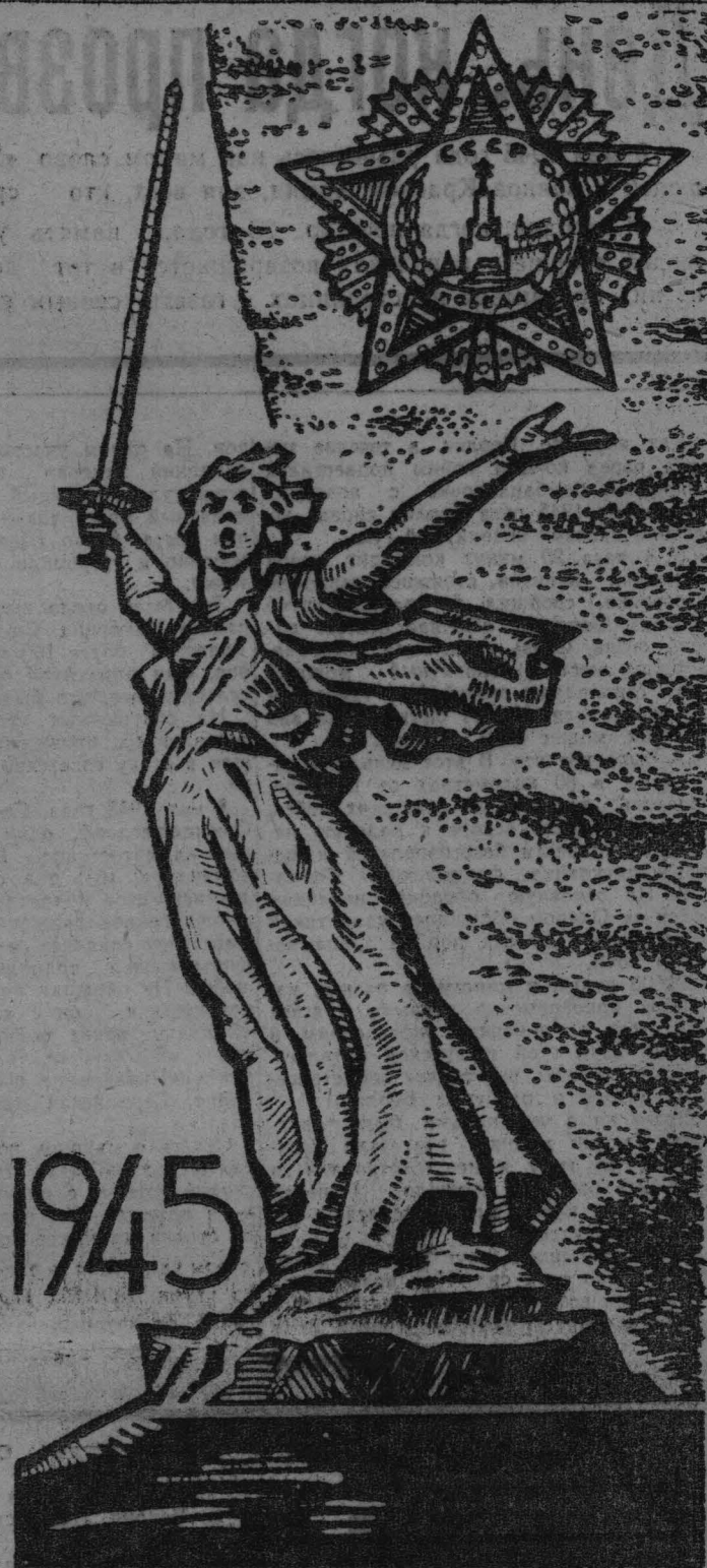
Рис. Г. Стаценко.

Англи, Франции, Чехословакии, США и других стран. Наша Родина сыграла решающую роль в достижении победы над фашизмом, понесла самые большие жертвы и обрушила на врага самые сокрушительные удары. Народы Советского Союза вели бой не только за себя, за свое настоящее и будущее, но и за свободу людей во многих странах Европы и Азии, порабоженных фашистскими агрессорами и их союзниками. В войне решался вопрос о жизни и смерти целых народов, о судьбах всей человеческой цивилизации. Кровавый поход империализма обернулся для него поражением. Разгром гитлеровской Германии и ее союзников в Европе и Азии открыл путь к свободе, независимости и социальному прогрессу многим народам и странам. Возник могучий социалистический лагерь. Послевоенный период принес великие успехи делу мира, демократии и социализма. Сейчас агрессивным замыслам и действиям империализма мировая система социализма противопоставляет свою крепнущую экономическую, социально-политическую и военную мощь.