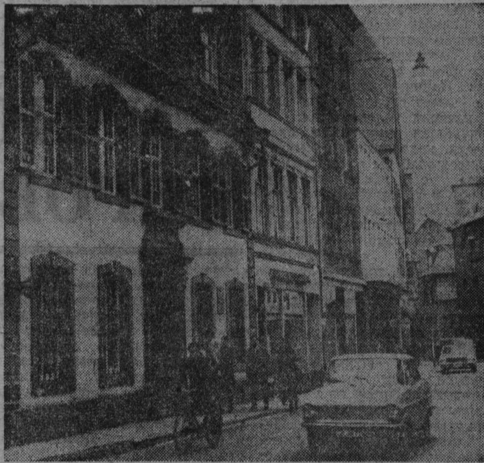
Дом номер 10 (крайний слева) по улице Брюкенштрассе в старинном немецком городе Трире, где 5 мая 1818 года родился Карл Маркс.

Г. ПИМЕНОВ, горный мастер шахты «Мансixa».