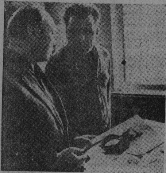
На Калининском полиграфическом комбинате к 150-летию со дня рождения основоположника научного коммунизма Карла Маркса готовится альбом «Карл Маркс и Фридрих Энгельс» на пяти языках.