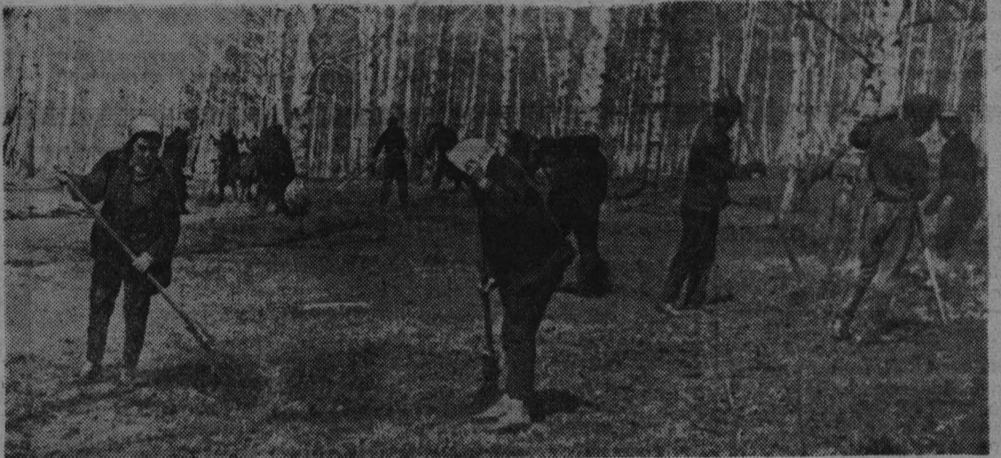
На снимке: трудящиеся энергоучастка станции Проктопьевск после работы выехали в Тырганский парк, чтобы привести в порядок его территорию.