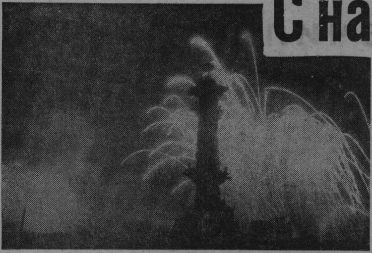
1945 год. Ленинградский салют победы.

ОРГАН ПРОМОПЬЕВСКОГО ГОРНОМА КПСС И ГОРОДСКОГО СОВЕТА ДЕПУТАТОВ ТРУДЯЩИХСЯ