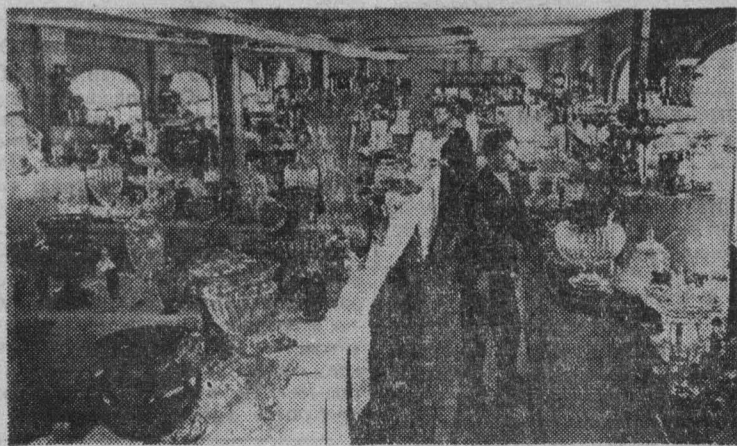
19 августа исполняется 175 лет со дня основания (1790) Дятьковского хрустального завода.

Е. ЗОРИНА, старший библиограф отраслевой научно-технической библиотеки треста Прокопьевскуголь.