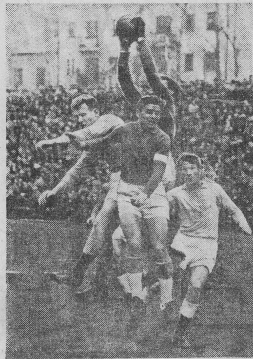
На снимке: мяч у вратаря гостей.