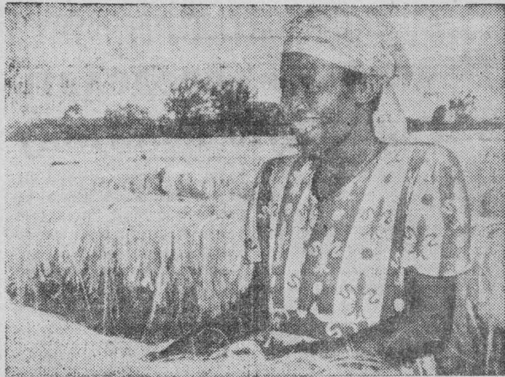
Кения — слаборазвитая сельскохозяйственная страна. Здесь на экспорт возделывают кофе, чай, сизаль и некоторые другие культуры. Правительство молодого африканского государства оказывает помощь крестьянам. На снимке: сушка сизаля.