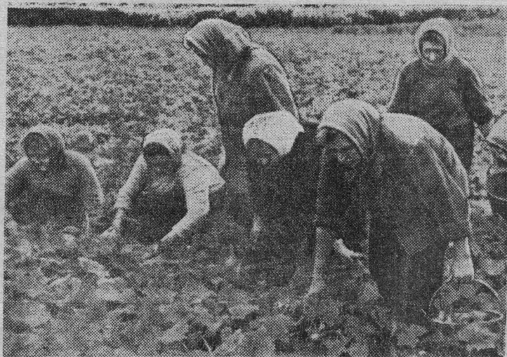
Идет уборка огурцов в теплично-парниковом хозяйстве.