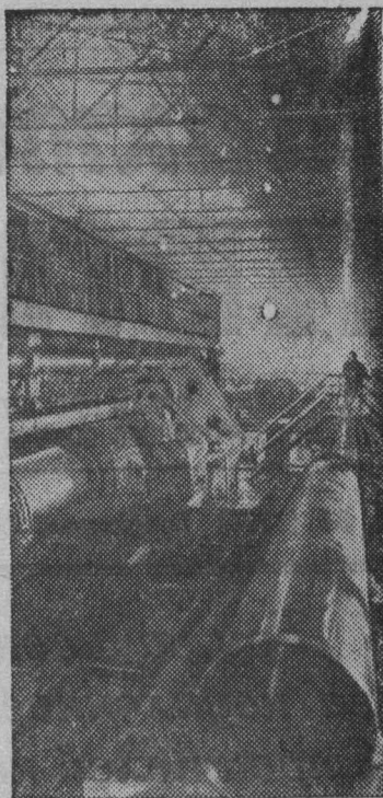
ЧЕЛЯБИНСК. Коллектив рабочих и специалистов нового трубоэлектросварочного стана «1020» на Челябинском трубопрокатном заводе успешно осваивает выпуск стальных труб большого диаметра.

В прениях выступили многие участники совещания. Все они поднимали жизненно важные вопросы, говорили о великой созидательной силе соревнования, об успехах экономической и культурной жизни страны, выдвигали новые задачи и практические пути к их решению. (ТАСС).