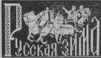
Оргкомитет по проведению праздника.

Шахте «Зиминка 3-4» требуются на постоянную работу на участок ПВС горные инженеры и техники на должность мастера.