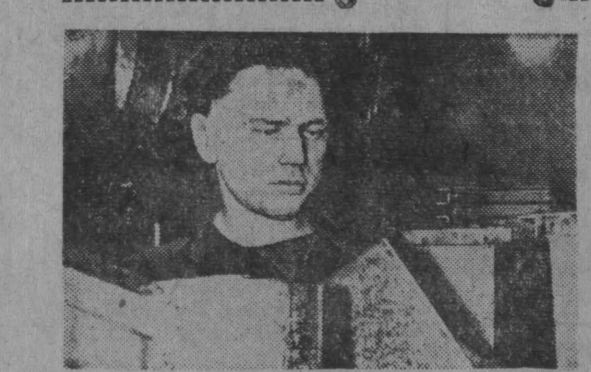
Идя навстречу выборам, коллектив второго сборочного участка завода «Продмаш» обязался на два дня раньше срока выполнить месячное задание, выпускает продукцию только отличного качества и постоянно сохранять в чистоте рабочие места.

— Нет, уберем их. «Других» она казалась больше. Они готовы были сразу после собрания приступить за дело. Но где взять материалы? Алексей Ильич побывал в жилищно-коммунальном отделе шахты «Коксова-2», и вскоре материалы появились. Жители домов №№ 26, 28 и 30 огородами шпательными площадями, сделали камнями, лодочки, зачели, высидили около 100 молодых тополей. Зеленые насаждения появились около всех домов. По настоянию Воткина во дворах многоэтажных домов сделали выгребные ямы и стандартные стайки. По первой Обской убралли годами сваливаемый шлак и мусор, засыпали тротуары дорожки. Отремонтировали дорожку и по второй Обской. Жители перестали тротуары. Добрые дела кузнецов Вотковых у всех на виду. И дела не только депутатские. Алексей Ильич отличился и в труде. Он один из лучших рабочих на шахте «Коксова-1». Коллектив этой шахты уже четвертый раз выдвигает его кандидатом в депутаты горсовета. Е. ЛИВШИЦ , секретарь многотиражной газеты «Советский горняк».