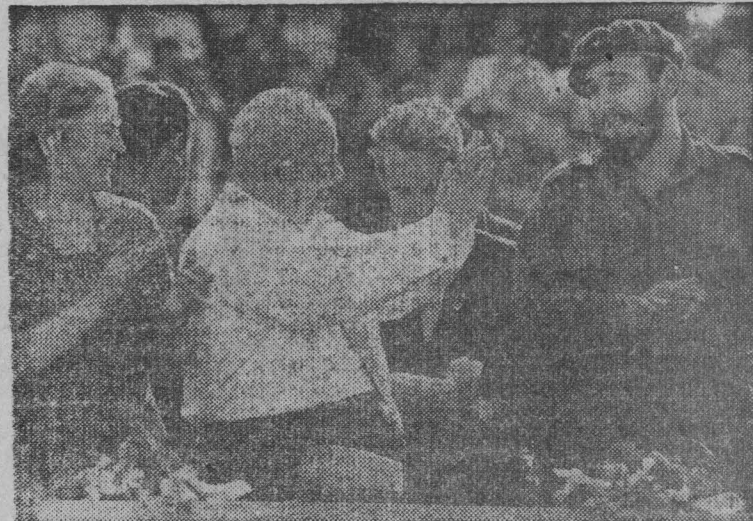
МОСКВА Митинг дружбы между народами Советского Союза и Республики Куба на Центральном стадионе имени В. И. Ленина. На снимке: Н. С. Хрушев и Фидель Кастро на трибуне.