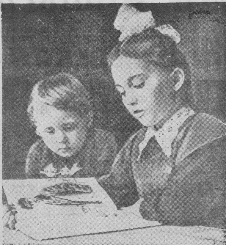
Фотоэтиюд К. Яковлева.

В. ВАСИЛЕНКО, кандидат исторических наук.